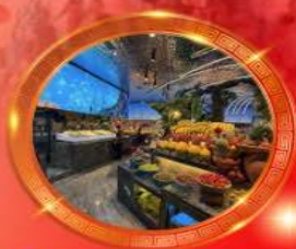
มื้อพิเศษ บุฟเฟต์นานาชาติ