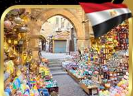
ตลาดชานอลคาลิ