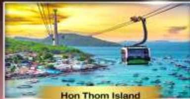
Hon Thom Island