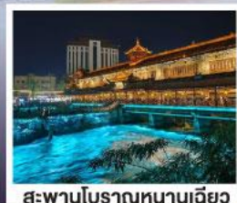
สะพานโบราณหนานเฉียว