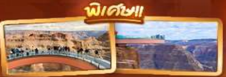
ชมความยิ่งใหญ่ของ GRAND CANYON WEST SKYWALK

เดินทาง 6-14 มี.ค.69 / 20-28 มี.ค.69 3-11 เม.ย.69 / 10-18 เม.ย.69 1-9 พ.ค.69 / 29 พ.ค. - 6 มิ.ย.69