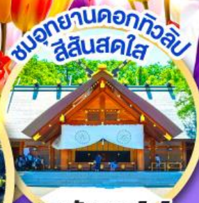
สวนอกยาดอกทิวลิป สีสันสดใส