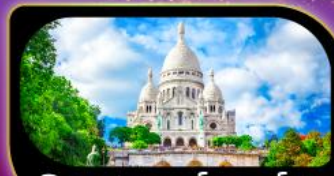
วิหารสกรเทอร์ มงมาร์ต