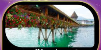
สะพานไม้ชาเปล คูซีน