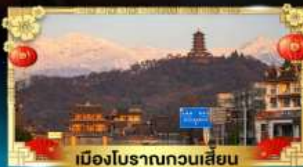
เมืองโบราณกวนเสียน