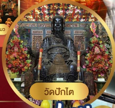
วัดปักโต